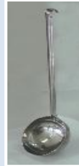
Slika 1. Grabilica za ručno uzimanje uzoraka mlijeka

Pribor za uzimanje uzoraka mlijeka mora biti čist i suh (slika 1).