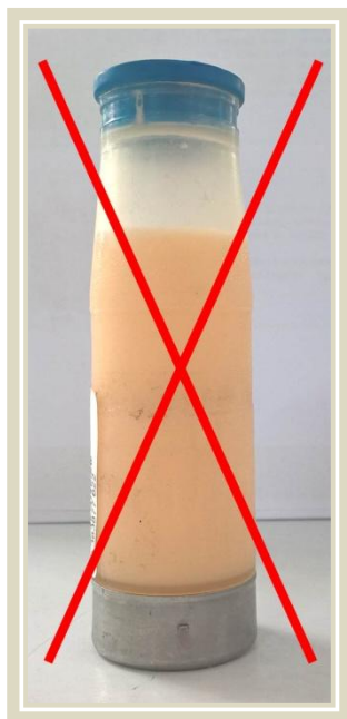
Slika 9. Uzorak sa konzervansom bronopolom (narančasta boja)

Uzorci se šalju isključivo s konzervansom azidiolom (plava boja), nikako s konzervansom bronopolom (narančasta boja - slika 9).