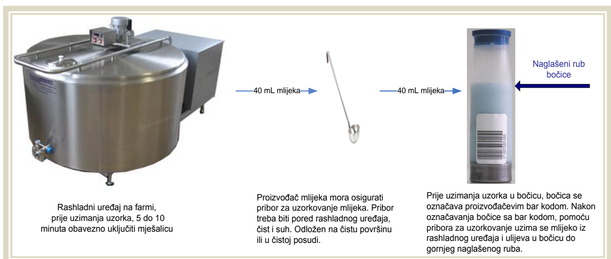
Shema 2. Postupak uzimanja prosječnog uzorka mlijeka iz rashladnog uređaja

Kod proizvođača mlijeka koji posjeduju rashladne uređaje u kojima se nalazi mlijeko proizvedeno na njihovom gospodarstvu, uzorak mlijeka uzima se iz rashladnog uređaja. Postupak uzimanja uzorka kod proizvođača mlijeka koji posjeduju vlastite rashladne uređaje, prikazan je na shemi 2.