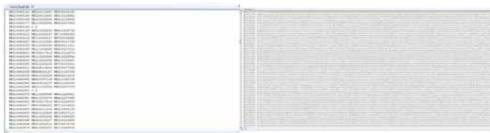
Slika 3. Ulazne datoteke za provjeru porijekla u programu SeekParentF90

Pored navedenih datoteka, pri izvedbi programa mogu se dodatno upotrijebiti i druge korisne datoteke kao što su datoteke koja sadrže životne brojeve genotipiziranih očeva i/ili majki prisutnih u porijeklu te se koriste kao baza za pretraživanje potencijalnih roditelja u slučaju konflikata u porijeklu. Ujedno se mogu mijenjati pragovi za postotak SNP-ova za provjeru konflikata roditelj-potomak (zadana vrijednost je 1% od ukupnog broja SNP-ova) kao i još neki korisni argumenti vezani uz strukturu SNP datoteke. Također je moguće koristiti i popis SNP-ova za provjeru porijekla definiranih od strane ICAR-a. Program za svaku genotipiziranu životinju provjerava odnos s genotipiziranim roditeljem (ocem i majkom). Nepodudaranje u porijeklu se proglašava ako je broj Mendelovih konflikata veći od praga. Po izvedbi programa dobiju se tri datoteke s rezultatima: